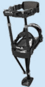
La béquille mains libres iWALK 2.0.

Pour plus de renseignements, visitez iwalk-free.com (anglais seulement).