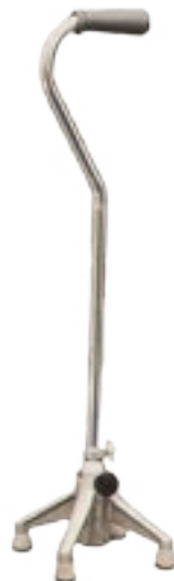
Il existe plusieurs modèles de cannes.

Utiliser une canne procure une stabilité accrue et peut suffire à sécuriser la personne amputée d'une jambe. Il existe toutes sortes de cannes; l'une d'elles possède même un crampon rétractable pour garantir une prise plus fiable l'hiver. Par ailleurs, des béquilles peuvent se révéler utiles, notamment quand vous devez vous déplacer sans votre membre artificiel, par exemple lorsqu'il est en réparation. En général, les cannes et les béquilles courantes répondront à vos besoins, mais vous pouvez aussi vous tourner vers un équipement un peu plus spécialisé. Par exemple, si vous voyagez, une canne télescopique ou des béquilles pliantes peuvent s'avérer utiles. Les cannes s'ajustent de 24 à 40 pouces (61 à 102 cm). Les béquilles pliantes peuvent mesurer jusqu'à 59 pouces (150 cm) dépliées, et être réduites à 25 pouces (64 cm) lorsqu'elles sont pliées,